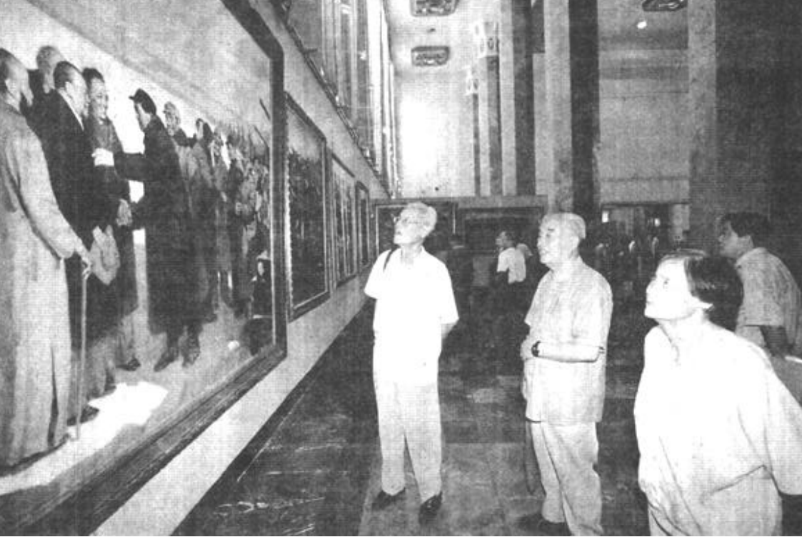
7月22日，由中国美术家协会、中共宁波市委、中共上海市委联合举办的“纪念中国共产党成立80周年大型油画展”在中国革命博物馆举行。展览共展出大型油画作品50余幅。

江泽民主席在乌克兰雅尔塔访问 朱镕基在安徽考察工作时强调，认真研究新情况，及时解决新问题，继续做好农村税费改革试点工作 胡锦涛听取西藏自治区工作汇报并发表讲话 尉健行在黑龙江考察工作时强调，按照“三个代表”的要求，以创新精神加强纪检监察工作 (均据新华社)